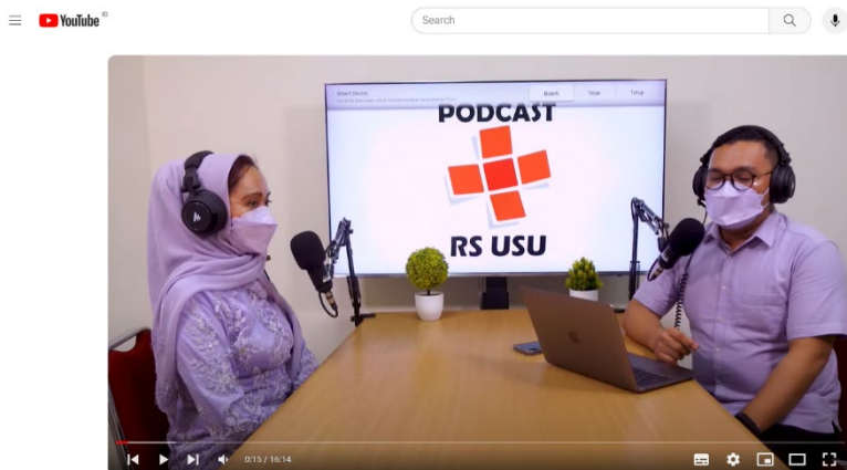
Podcast RS USU Ep. 17 - Konsultasi ke Psikiater, Siapa Takut? "Hapus Stigma"