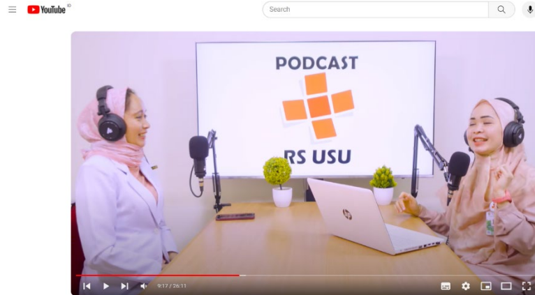
Podcast RS USU Ep. 40 - Mengenal Gejala Dini Gangguan Mental Emosional